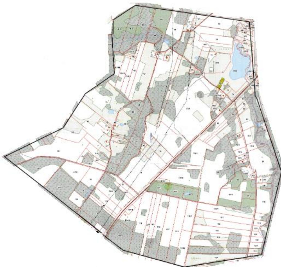
Rysunek nr 3. Obszar rewitalizacji na terenie Gminy Kuźnica (Chreptowce)

Gminny Program Rewitalizacji Gminy Kuźnica przewiduje osiągnięcie następujących celów rewitalizacji::